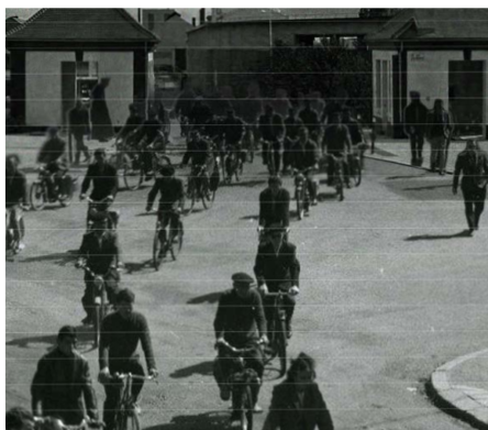
Sortie d'usine