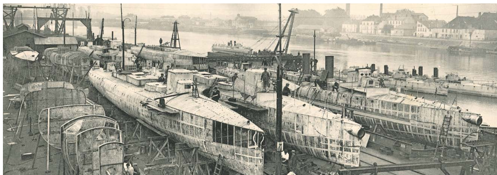
Montage d'un torpilleur de la marine impériale ottomane aux chantiers de Chalons-sur-Saône

Infos : www.afbourdon.com - contact@afbourdon.com / 03 85 80 81 51