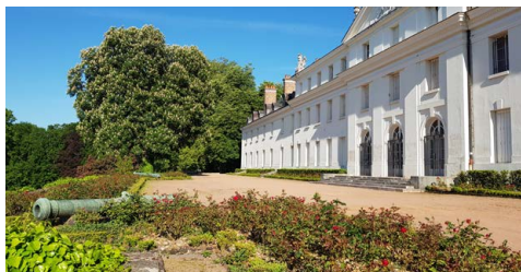
Vue des terrasses du château de la Verrerie

Découvrez la transformation au fil des époques d'un four de fusion du verre et cristal datant de 1787. Vous en saurez plus sur le parc de la Verrerie et ses créateurs, les Duchêne. (durée de la visite environ 1h00)